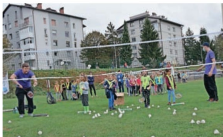
Otroci so se preizkusili tudi v badmintonu.